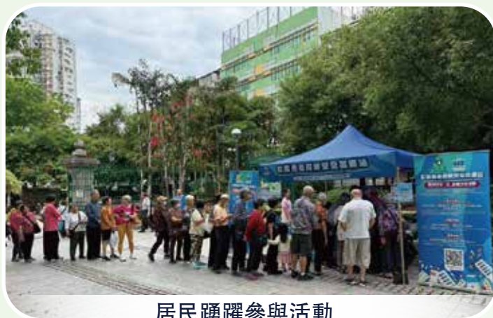
居民踴躍參與活動