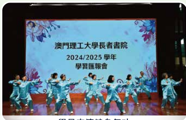
學員表演健身氣功

本年匯報會內容豐富，參與班別各施其藝，學員在演唱、舞蹈及樂器演奏等方面都有令人驚喜的地方，體現了老師和學員的共同努力，期望學員能透過不同平台累積表演經驗，持續發揮自身潛能。