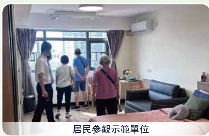
居民參觀示範單位