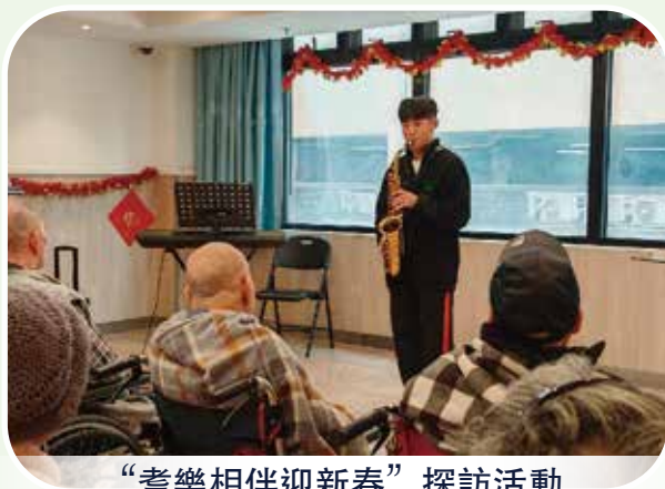
“耆樂相伴迎新春”探訪活動