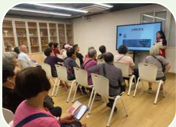
長者積極參與培訓活動

為進一步將資源下沉社區，幫助長者、殘疾人士和有需要人士加強應用智能手機的能力，提升他們日常生活的便利程度，社會工作局開展“智能手機應用推廣活動”，內容包括舉辦智能手機應用培訓活動、社會服務人員教學工作坊及智能手機應用教學街站，以教導市民，尤其是長者和殘疾人士，學習有關“一戶通”、“我的健康2.0”、電子支付和數碼點餐等操作方法。