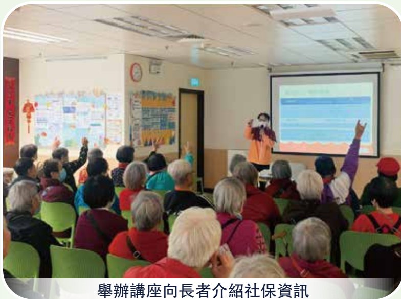
舉辦講座向長者介紹社保資訊

社會保障基金持續開展長者理財教育活動，2025年繼續與司法警察局合辦講座，向長者介紹雙層式社會保障制度、最新的社保電子服務，以及防騙資訊。2025年上半年共舉辦4場講座，約有210位來自耆康中心及長者日間中心的長者出席，長者們積極參與，達到預期目的。