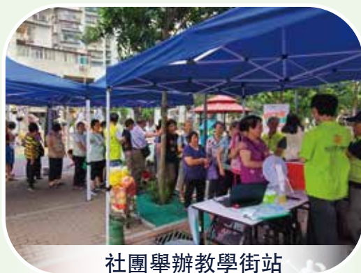
社團舉辦教學街站

相關活動和教學街站將持續舉辦至2025年12月，預計80多間社服設施將開展超過9,800次培訓活動，6個社團將舉辦約90場教學街站，持續向市民提供智能手機應用教學和相關技術支援。