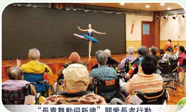
“長青舞動迎新歲”關愛長者行動

為培養學生對社會服務的熱忱，弘揚尊敬與關愛長者的價值觀，澳門演藝學院舞蹈學校與音樂學校於2025年1月24日分別組織師生探訪長者機構，傳遞歲末溫暖。舞蹈學校學生獻上芭蕾舞及民間舞等表演，展現多元舞蹈魅力；演出後與長者互動遊戲，參觀機構環境，以及認識失智症的照顧需求。而音樂學校學生透過獨奏、合奏及合唱方式演繹經典樂曲；長者隨著節奏拍掌跟唱，場面溫馨感人。兩校活動不僅為長者帶來歡樂與關懷，同時讓學生體悟敬老護老、服務社會的價值。