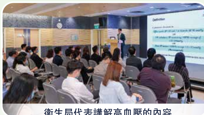
衛生局代表講解高血壓的內容