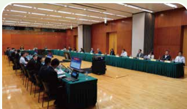
舉行策導小組2025年度第一次聯合會議

養老保障機制跨部門策導小組及康復服務十年規劃跨部門策導小組2025年度第一次聯合會議於2025年5月22日在澳門文化中心會議室舉行，由策導小組組長、社會文化司柯嵐司長主持會議。會上確定下一階段兩個十年行動計劃的考慮原則、協調及監督機制、簡介十年行動計劃總結及意見收集會相關工作安排，以及引介制訂行動計劃日程安排及跟進工作等。