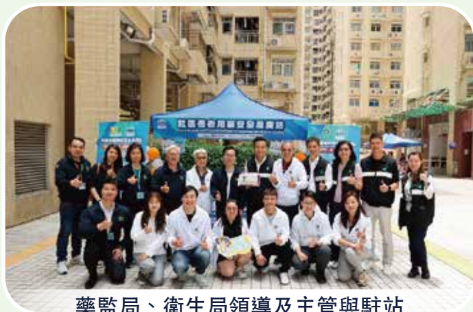
藥監局、衛生局領導及主管與駐站藥劑師和工作人員合照

衛生局與藥物監督管理局合作，聯動社團、醫療機構及藥學專業學會，於2025年5月10日及11日在本澳10個民生社區舉辦長者用藥安全推廣活動，推動社區藥物管理，提升長者正確及安全用藥知識水平，促進長者合理用藥，進一步提高藥物治療效果，同時減少藥物浪費。活動圓滿舉辦，整體成效顯著，參與活動人數逾4,000人，當中部分存在高風險服藥行為的長者將轉介衛生局藥物諮詢門診作進一步跟進。