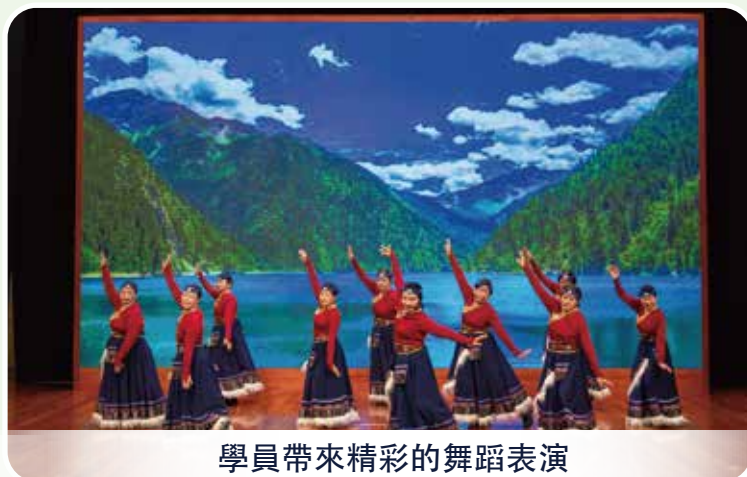
學員帶來精彩的舞蹈表演

長者書院作為長者獲取知識、強健體魄、陶冶性情的學習平台，持續優化教學活動，結合多樣式學習、社區及全國性活動，豐富長者知識與技能，提高長者與社會的連繫，營造良好的學習氛圍。