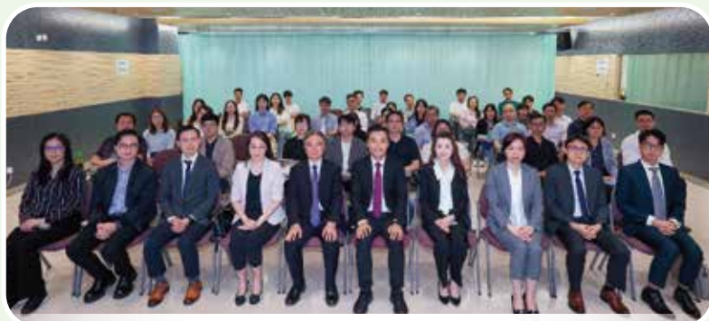
衛生局舉行“慢性病篩查計劃”培訓班

衛生局將於2025年8月1日推出“慢性病篩查計劃”，旨在拓闊醫療券應用範圍至慢性病預防保健服務，進一步提升“醫療補貼計劃”效能，強化與私營醫療業界合作，協助提升包括長者在內的居民，及早發現和預防慢性病的意識，促進主動健康管理。為提升社區醫療的服務能力，衛生局於2025年6月14日至29日舉行2班“慢性病篩查計劃”培訓班，向參與該計劃的西醫生提供10小時系統性培訓和認證，該培訓班深受年青醫生歡迎，共約90人參加，當中約8成是45歲以下的醫生，近5成是35歲以下的年青醫生。