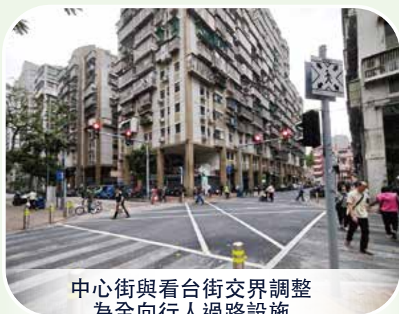
中心街與看台街交界調整 為全向行人過路設施

為進一步優化過路環境及保障行人安全，交通事務局經檢視中心街與看台街交界現時的交通情況、道路條件，並與周邊學校、交通諮詢委員會溝通後，將上述路口由原來的斑馬線過路通行設計，調整為全向行人過路設施，透過交通燈號控制分隔行車及行人過路次序。有關設施已於2025年4月12日正式啟用。