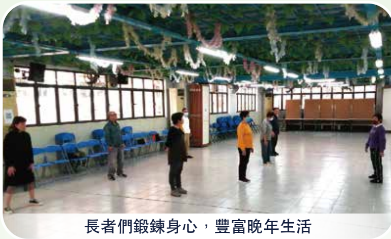
長者們鍛鍊身心，豐富晚年生活

終身學習旨在讓社會各持份者獲得平等學習的機會，同時亦為長者創造不同層次參與社會的契機。“持續進修發展計劃”（下稱“計劃”）除提升居民的學習興趣，使學習成為生活的一部分，亦保障長者學習的權利，與時並進，更可協助長者自我實現，豐富長者的精神文化生活。