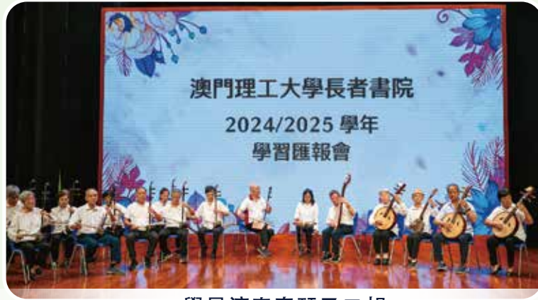
學員演奏秦琴及二胡