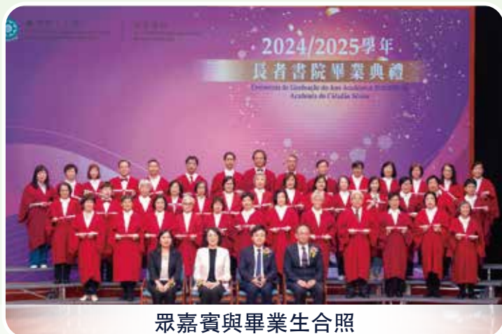
眾嘉賓與畢業生合照