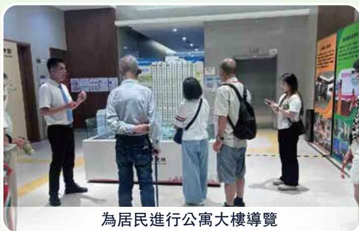
為居民進行公寓大樓導覽

另外，社會工作局正開展政府長者公寓長者生活現況調查的籌備工作，期望藉有關調查為未來服務的供應與發展提供參考。