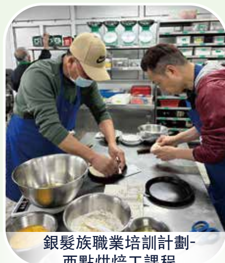
銀髮族職業培訓計劃-西點烘焙工課程

此外，勞工事務局於2025年3月與澳門婦女聯合總會開辦了第2期「母嬰生活照護入門課程」，並已於2025年4月完結，課程50小時，共21人參與培訓，20人畢業。有關課程為年齡為55歲或以上、具中文書寫及閱讀理解能力之人士而設，協助有意願且具工作能力的長者繼續就業或重投就業市場。