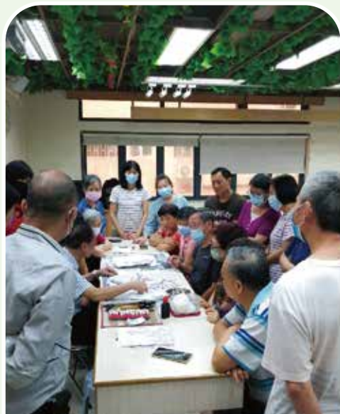
長者積極參與不同的學習活動