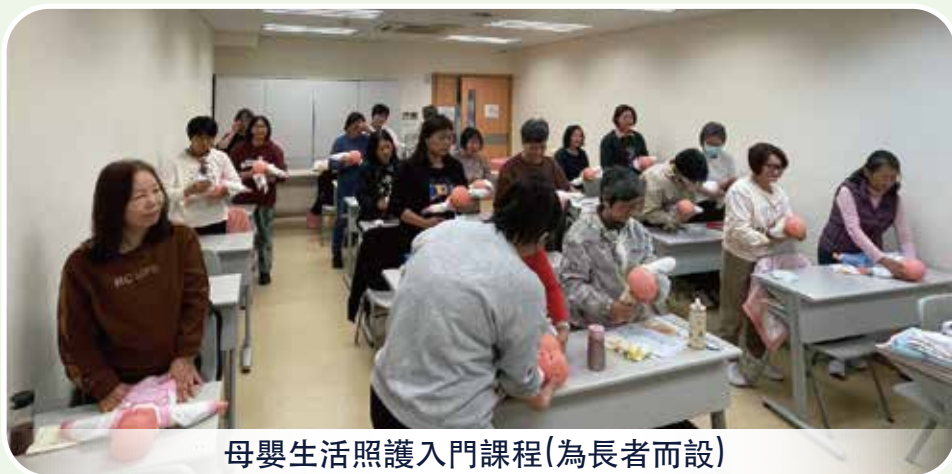
母嬰生活照護入門課程(為長者而設)

勞工事務局於2025年2月與澳門工會聯合總會開辦「銀髮族職業培訓計劃-第1期中西餐侍應課程」，培訓對象為報讀年齡介乎於55至70歲的澳門居民，課時80小時，已於2025年3月完結，共20人參與培訓，18人畢業。