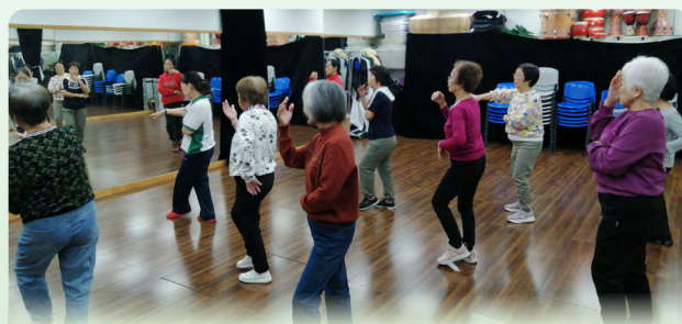
學習保健養生操，促進長者身體健康