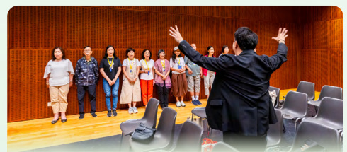
《樂齡好聲音》工作坊