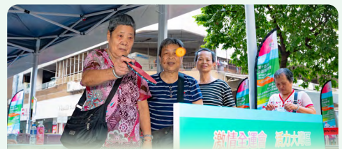
迎全運 x 社區運動同樂日