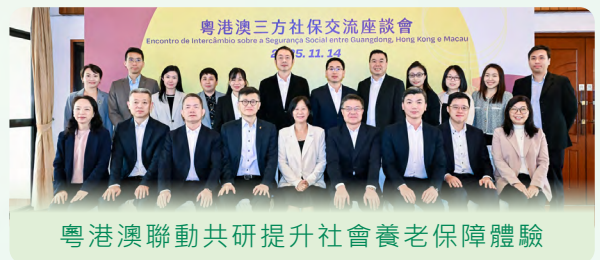
粵港澳聯動共研提升社會養老保障體驗

廣東省社會保險基金管理局、澳門特別行政區政府社會保障基金、香港特別行政區強制性公積金計劃管理局於 2025 年 11 月 14 日舉行交流座談。三方回顧過往的合作成果、介紹粵港澳三地社保及公積金制度的最新發展，以及就着各方關注的議題進行探討。未來期望持續深化服務對接、推動資料聯通，互相借鑑先進經驗，共同提升服務水平和保障力度，助力居民尤其長者養老和生活更便利。