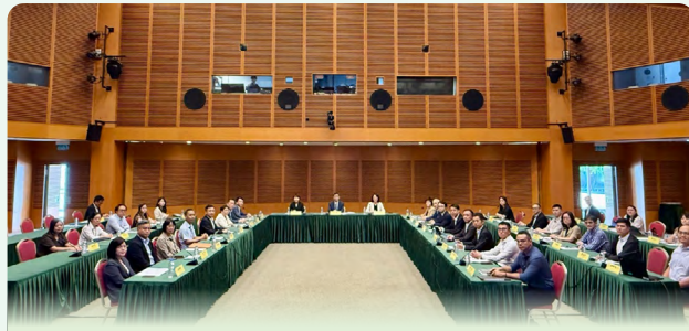
舉行策導小組 2025 年度第二次聯合會議