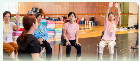
《樂齡郁郁貢》工作坊

2025年7至8月第二屆澳門國際兒童藝術節舉行期間，文化局舉辦了2項專為55歲或以上人士而設的工作坊，為長者提供活動的機會，促進身心健康。其中，《樂齡郁郁貢》工作坊共有6節，融合舒緩伸展、節奏律動與創意即興，在安全愉悅的環境中，幫助長者放鬆肌肉、提升柔軟度與平衡感，透過音樂與肢體的對話，重新感受身體的自由與活力，同時促進社交互動與心靈愉悅；而《樂齡好聲音》工作坊共有4節，以輕鬆互動的方式，帶領老友記掌握呼吸控制、發聲技巧與情感表達，更好地演繹經典金曲和充分表現作品的內容和感情。