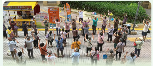
工作人員帶領居民練習實用的伸展動作

衛生局積極落實“健康社區”計劃，與教育及青年發展局、市政署及房屋局合作，聯動社團於2025年8月9至10日在本澳不同區域，共設置10個社區健康諮詢站點，深入社區向居民推廣運動的重要性，營造全民運動及隨時隨地做運動的良好氛圍，促進居民身心健康。兩天活動共吸引約14,000人次參與，活動圓滿舉辦，居民反應熱烈。活動內容豐富多元，包括：運動小遊戲、居家運動示範、中醫諮詢，以及向居民宣傳防範基孔肯雅熱及登革熱、心理健康等。