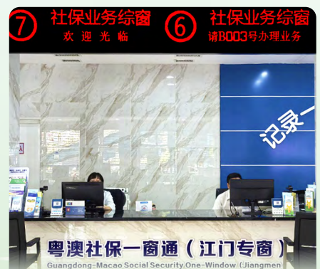
“粵澳社保一窗通”進駐江門便利當地澳人

社會保障基金透過粵澳合作，近年先後於橫琴合作區、廣州市南沙區以及中山市建設了“粵澳社保一窗通”專窗，透過“一個服務大廳、提供兩個地區服務”，實現粵澳社保融合辦。2025 年 8 月，“粵澳社保一窗通”專窗服務進一步延伸至江門市，方便身處當地的澳門居民辦理粵澳兩地的社保公共服務。