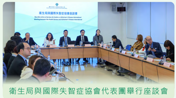
衛生局與國際失智症協會代表團舉行座談會