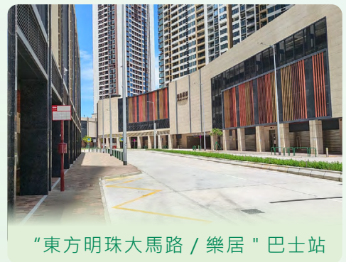
“東方明珠大馬路／樂居”巴士站

為進一步回應政府長者公寓及周邊新建住宅居民的出行需要，設於東方明珠大馬路之新巴士站——“東方明珠大馬路／樂居”站自 2025 年 9 月 23 日起正式啟用，供往澳門方向的 34 及 51A 路線，在經友誼大橋進入東方明珠大馬路後將增停該站，以更便利區內居民出行。