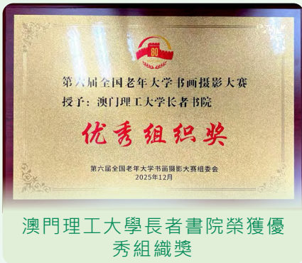
澳門理工大學長者書院榮獲優秀組織獎

是次活動由中國老年大學協會及浙江日報報業集團聯合主辦，以“銘記歷史·銀齡丹青”為主題，面向全國老年藝術愛好者徵集作品，共收到作品近 5,800 件。長者書院是次再積極組織學員投稿，共提送作品 31 幅，包括書法 26 幅、繪畫 4 幅及攝影 1 幅。經初賽篩選後，共 25 幅作品進入複賽，晉級率達 80%，最終共有 2 位學員作品脫穎而出，榮獲獎項。