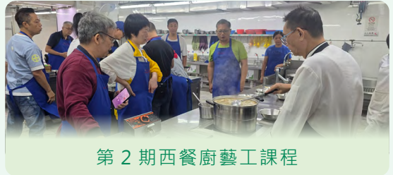
第 2 期西餐廚藝工課程