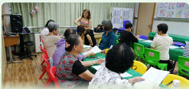
長者學習音樂，有助抒發情緒

截至 2025 年 12 月底，參與第五階段“持續進修發展計劃”課程的 65 歲或以上長者累計約 33,000 人次，涉及約 7,400 個課程，資助金額逾 2,900 萬澳門元。長者參與的課程主要包括健身操、太極、書法、音樂、衛生保健、舞蹈、語言及電腦科學等。