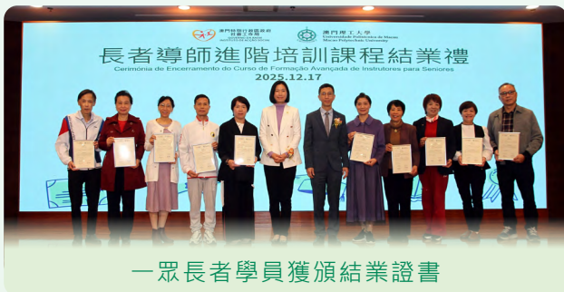
一眾長者學員獲頒結業證書

“長者導師進階培訓課程”於 2025 年 10 至 12 月進行，相關學員此前均曾修讀“長者導師培訓課程”或曾從事社服設施教學工作。是次課程旨在延續過往培訓成效，透過強化實務應用與專業指導，進一步提升學員的教學技巧及課程質量。學員共完成了 17 小時的面授課程、教學實踐及交流總結會，順利取得結業資格。