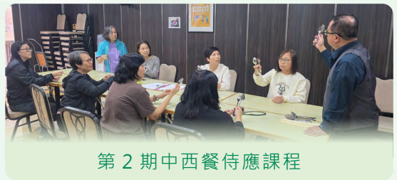
第 2 期中西餐侍應課程

勞工事務局於 2025 年 10 及 11 月與澳門工會聯合總會開辦餐飲業長者培訓課程，培訓對象為報讀年齡介乎於 55 至 70 歲的澳門居民，課時 80 小時。其中，「銀髮族職業培訓計劃 - 第 2 期中西餐侍應課程」共 20 人參與培訓，8 人畢業；「銀髮族職業培訓計劃 - 第 2 期西餐廚藝工課程」共 20 人參與培訓，11 人畢業。