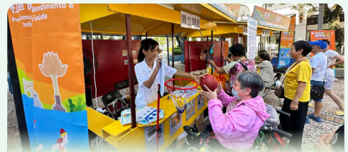
居民體驗籃球攤位遊戲